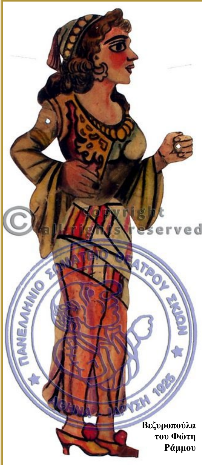
Βεζυροπούλα του Φώτη Ράμμου

της μέσα από την παράγκα διαμαρτυρόμενη για τα διάφορα τεχνάσματα του Καραγκιόζη, ενώ είναι αφοσιωμένη στο σύζυγό της, τα παιδιά της και το σπίτι της παρόλες τις δυσκολίες που περνάει.