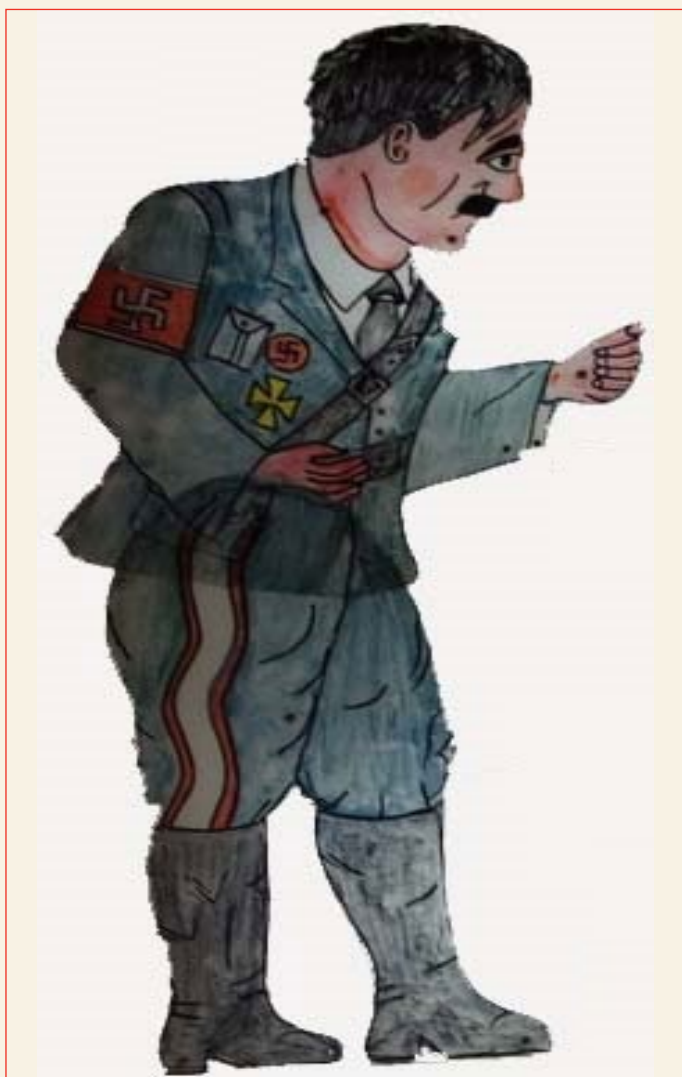
Αδόλφος Χίτλερ (Φιγούρα του Ευγένιου Σπαθάρη - Συλλογή Σπαθάρειο Μουσείο)

Πρέπει- βασικά- να δεχτούμε την αλήθεια πως η μουσική μας ήταν η πιο αστική απ' όλες μας τις τέχνες- αστική με την έννοια πώς εξυπηρετούσε την άρχουσα σ' εμάς τάξη, την αστική τάξη. Στην ξέφρενη, λοιπόν, τρεχάλα της ... νεοσύστατης ελληνικής αστικής τάξης να φτάσει την παγκόσμια αστική τάξη και να ευθυγραμμιστεί με την κουλτούρα της, πρώτη πήγαινε η μουσική της, και ξέκοβε τους μουσικούς της- σύνθετες και εκτελεστές- απ' την πηγή τους- την καθαρή πηγή- το Λαό τους και τη μουσική του.