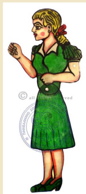
Κοπέλα του Γιώργου Χαρίδημου

προς το Θέατρο Σκιών Καραγκιόζη Τζουβάνα Καλλιόπη- Πόπη (Ράμμου)