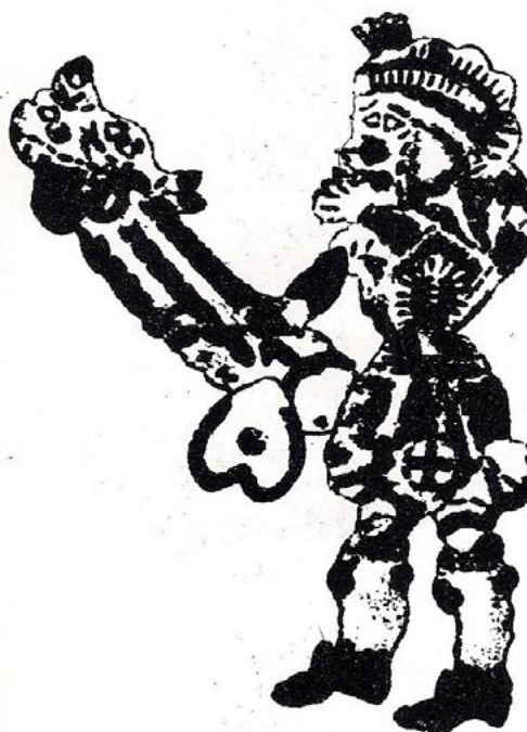
Karagöz with a giant size phallus

ταν από ξύλο (ύλη), είναι λογικό το ομοίωμά του, ο φαλλός, να γράφεται με δύο -λ δηλώνοντας και το Θεό (Φαλ-) και το υλικό κατασκευής (-λός).