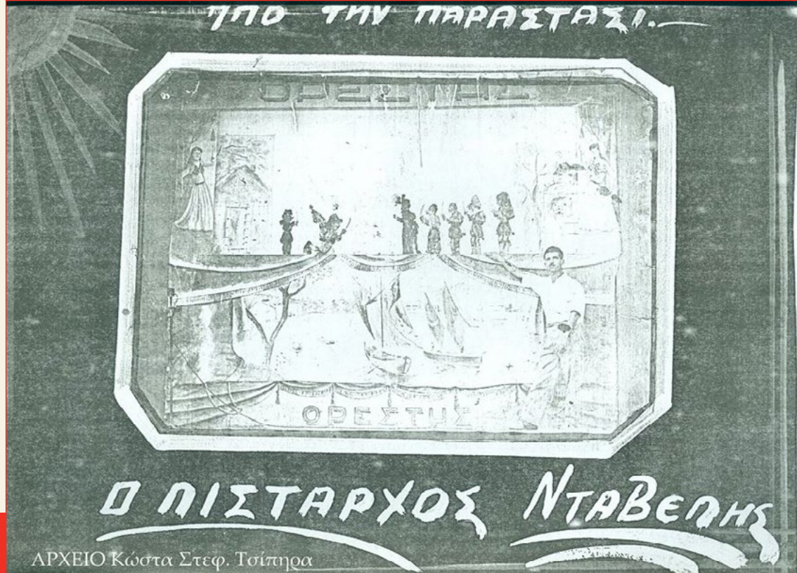
Ο Ορέστης με φιγούρες από το έργο: Ο Στρατηγός Βελισσάριος