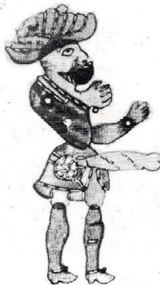
Karagöz with a phallus.

Περνώντας στο επώνυμο ή επίθετο παρατηρούμε πως αποτελείται από δυο ονόματα (ΓΡΗΓΟΡΗΤΟΥ-ΦΑΛΛΑΚΡΑΤΑ) σε πτώση γενική, η οποία δηλώνει την καταγωγή ή τη συγγένεια, που συνδέονται παρατακτικά με το σύνδεσμο ΚΑΙ. Το ΓΡΗΓΟΡΗΤΟΥ, ως κύριο εδώ όνομα, παράγεται από το ρήμα γρηγορέω (ενεστώτας που σχηματίστηκε μεταγενέστερα από τον παρακείμενο εγρήγορα) το οποίο σημαίνει είμαι ξύπνιος, βρίσκομαι σε εγρήγορση, φρουρώ, μένω άγρυπνος . Η κατάληξη -τος του ρηματικού επιθέτου συμπληρώνει τη σημασία: ΓΡΗΓΟΡΗΤΟΥ=(γιός) αυτού που μπορεί να μένει άγρυπνος, ξύπνιος. Στο δεύτερο σκέλος αυτού του παράξενου επωνύμου προσδιορίζεται η χρονική στιγμή , τόσο της κατάστασης που δηλώθηκε, όσο και της ενέργειας που έπεται, με τη γενική ΝΥΚΤΟΣ , για να ακολουθήσει το ΦΑΛΛΑΚΡΑΤΑ. Πρώτο συστατικό της λέξης είναι ο φαλλός, το ομοίωμα δηλαδή του ανδρικού γεννητικού οργάνου που το περιέφεραν με πομπή στη διάρκεια γονιμικών τελετών και οργίων ως σύμβολο της γονιμότητας της φύσης, απ' την αρχαιότητα ως τις μέρες μας. Και για να περιφέρει κανείς κάτι πρέπει να το κρατήσει ψηλά, πάνω σ' ένα κοντό, όπως ακριβώς δηλώνει το δεύτερο συστατικό της λέξης, -ΚΡΑΤΑ (εκ του ρήματος κρατώ). Εδώ, βέβαια, πρόκειται για ομοίωμα του θεού Φάλη που κατασκευαζόταν από ξύλο συκής, γι' αυτό μερικές φορές απεκαλείτο Σύκινος. Αφού, λοιπόν, ο Φάλης, η φαλλική θεότητα που η λατρεία της ήταν συνδεδεμένη με τη Διονυσιακή, κατασκευαζό-