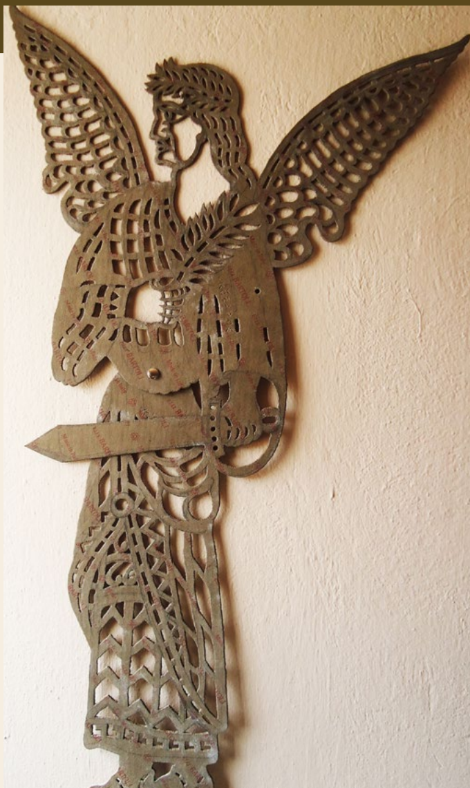
γδυτή φιγούρα σε σχέδιο Κώστα Μάνου

Όπως και στις δερμάτινες πάνω στο φύλλο της ζελατίνας, ή του τάπερ σήμερα, σχεδιάζουμε με μαρκαδο-