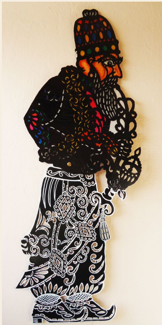
μεικτή φιγούρα, σκαλιστή βυζαντινή