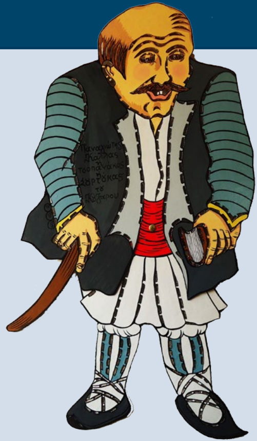
Φωτό 4 Ο Σουρτούκας, από τον Τάσο Κούζαρο

τον ακολουθεί στη Νεάπολη της Σικελίας, συμπληρώνοντας τις γνώσεις του σε θέματα Ευρωπαϊκής στρατιωτικής τακτικής. Τον Οκτώβριο του 1816 ο Νικηταράς δέχεται ισχυρότατο πλήγμα, καθώς οι Τούρκοι συλλαμβάνουν και εκτελούν στη Μονεμβασιά τον πατέρα του και τον αδελφό του Ιωάννη. Ο τραγικός χαμός τους θέριεψε μέσα του την επιθυμία για εκδίκηση, που τον μετέτρεψε σε πραγματικό Τουρκοφάγο. Το φθινόπωρο του 1818 επιστρέφει στην Πελοπόννησο και στις 18 Οκτωβρίου του ίδιου χρόνου μυείται στη Φιλική Εταιρεία από τον παλιό του φίλο Ηλία Χρυσοσπάθη. Μια συμπλοκή με Τούρκους στην Αλωνίσταινα θα τον αναγκάσει να καταφύγει και πάλι στη Ζάκυνθο, όμως τον Φεβρουάριο πλέον του 1821 επιστρέφει στο Μοριά, για να ξεκινήσει την απaráμιλλη επική του πορεία, καθιστώντας το όνομά του συνώνυμο του τρόμου για τους τυράννους της πατρίδας.