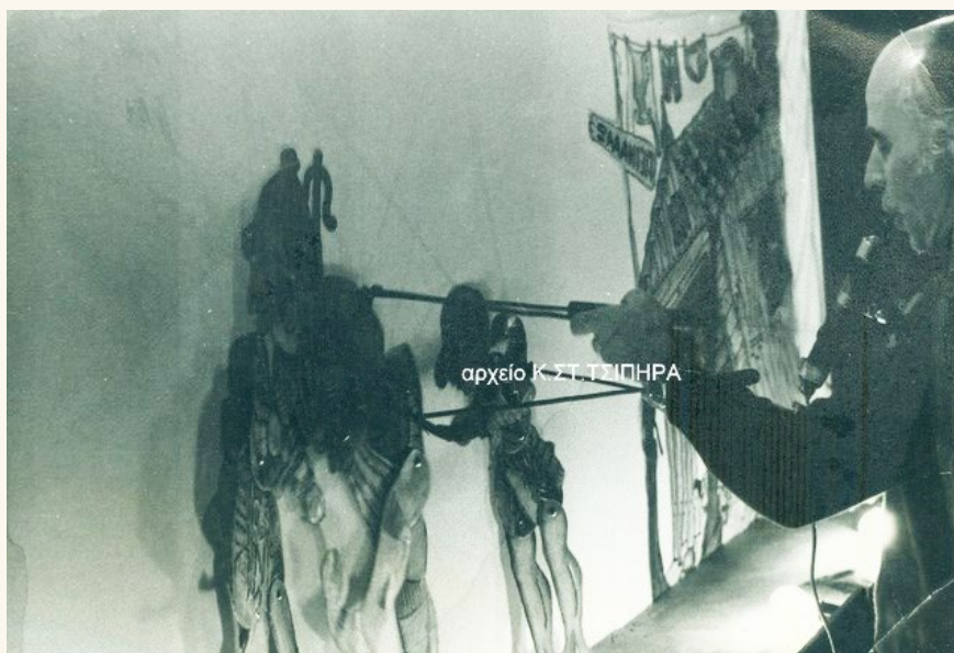
Ο αείμνηστος Βάγγος