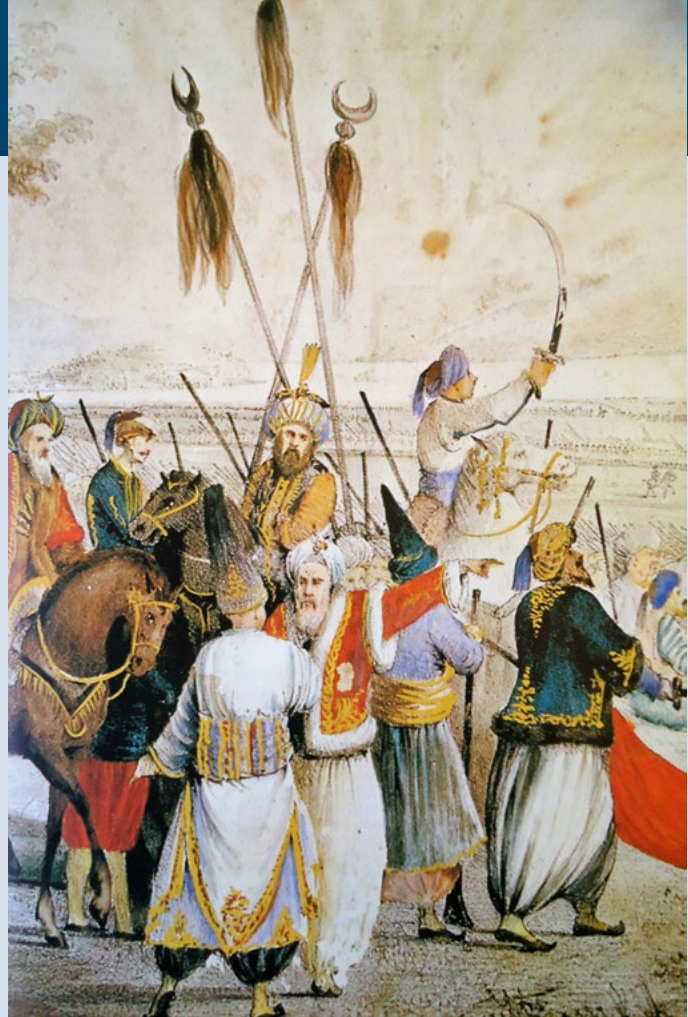
Φωτό 5 Η στρατιά του Δράμαλη

Αν ο Νικηταράς απέκτησε το προσωνόμιο του Τουρκοφάγου στα Δολιανά το επιβεβαίωσε, ώστε να μην τον εγκαταλείψει ποτέ, στις μάχες στα Δερβενάκια και ιδιαίτερα στη μάχη του Αγίου Σώστη. Ο Παναγιώτης Σούτσος, που εκφώνησε τον επιτάφιο λόγο προς τιμήν του μεγάλου νεκρού στο νεκροταφείο Αθηνών, περιγράφει με συγκλονιστικό τρόπο την καταιγιστική δράση του Νικηταρά, καθώς τον δημοσίευσε η εφημερίδα ΑΙΩΝ την Τετάρτη 28 Σεπτεμβρίου του 1849. Σας παρουσιάζουμε το σχετικό απόσπασμα σε απλή νεοελληνική: «..... ο Δράμαλης έρχεται. Στρατός 28.000 Οθωμανών και 50 χιλιάδων καμηλών, μουλαριών και αλόγων που παρακολουθούνται από υπηρέτες και ιπποκόμους προχωρεί σαν μαύρο σύννεφο που σκιάζει τη γη.... σιωπή λίγων λεπτών γίνεται. Αλλά κάποιος ψηλός άντρας από τον ελληνικό στρατό πηδά πρώτος, τα μάτια του αστράφτουν, καθώς και το γυμνό του σπαθί «Πέρσες! φωνάζει Πέρσες! Οι Έλληνες σας εφάγαμεν. Εγώ είμαι ο Νικήτας!» (....Σαν λεοντάρι χλεμερτεί, τους Τούρκους τους καταπατεί.. συμπληρώνει την εικόνα ο Τσοπανάκος). «Ο τουρκικός στρατός στέκει, οι Έλληνες ορμούν. Όσοι βράχοι, όσοι λόφοι, όσοι πλάτανοι, όσοι λίθοι, Όλοι Έλληνες με τα σπαθιά στα χέρια φαίνονται στα μάτια των δειλισμένων Οθωμανών, που είχαν τον Κολοκοτρώνη πίσω