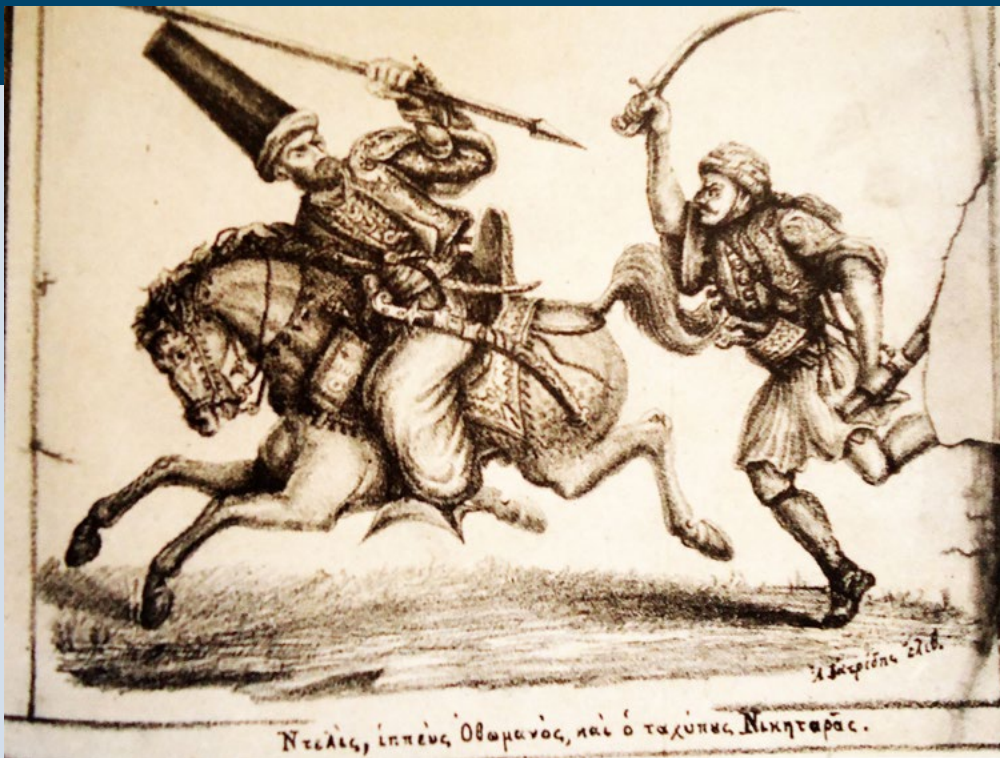
Φωτό 6 Ο ταχύπους Νικηταράς