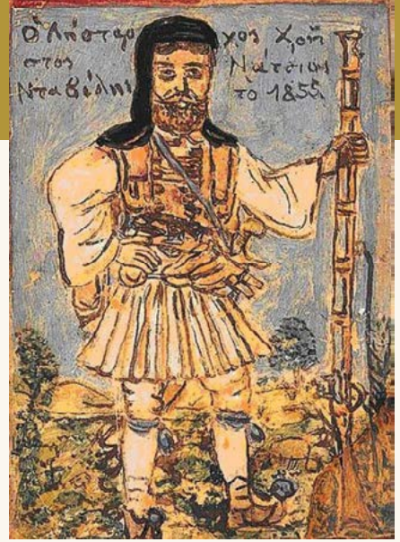
πίνακας του Θεόφιλου

Το κείμενο αυτό δημοσιεύθηκε σε μία πρώτη μορφή στο περιοδικό του Θεάτρου Σκιῶν «Καραγκιοζολόγιον» (τεύχος 2 ο , Χινόπωρος 2016) και εκφωνήθηκε στο 2 ο Συνέδριο του Πανελληνίου Σωματείου Θεάτρου Σκιῶν (Νέα Ιωνία, 14 Ιουνίου 2017), απ' όπου και η παρούσα δημοσίευση.