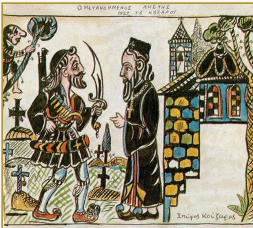
«Ο μετανοημένος ληστής»: ρεκλάμα του Σπύρου Κούζαρου

Ὅπως εἶδαμε, ὑπάρχουν πολλὰ ἔργα καὶ κάποια ἀπὸ αὐτὰ ξεχασμένα, ποὺ δὲν παίζονται στίς μέρες μας, ἀλλὰ εἶναι ἓνα μεγάλο καὶ σημαντικὸ κομμάτι τῶν πολ- λῶν παραστάσεων τοῦ ἐλληνικοῦ θεάτρου σκιῶν.